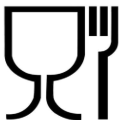
Рис. 1. Упаковка (укупорочные средства), предназначенная для контакта с пищевой продукцией

Символ, обозначающий, что упаковка предназначена для контакта с пищевой продукцией, допускается наносить как без рамки, так и в рамке (круглой, квадратной и др.).